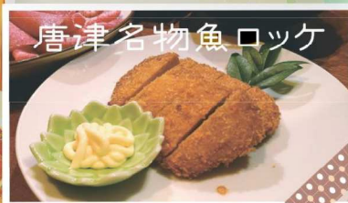
唐津名物魚ロック