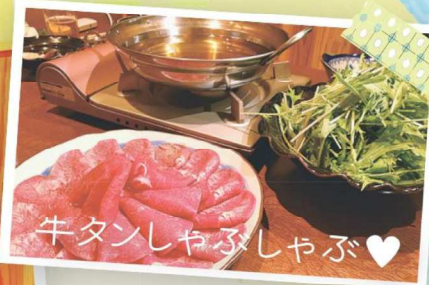
牛タンしゃぶしゃぶ♡