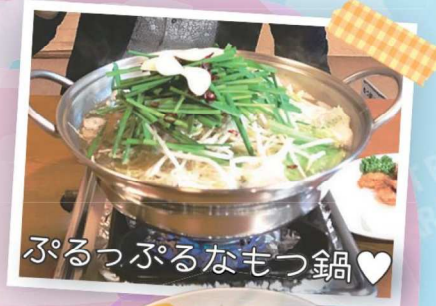
ぷるっぷるなもつ鍋♡