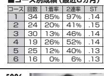
4908 上田 龍星 (A1・大阪・29歳)