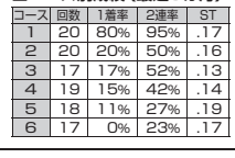
4448 青木 玄太 (A1・滋賀・39歳)